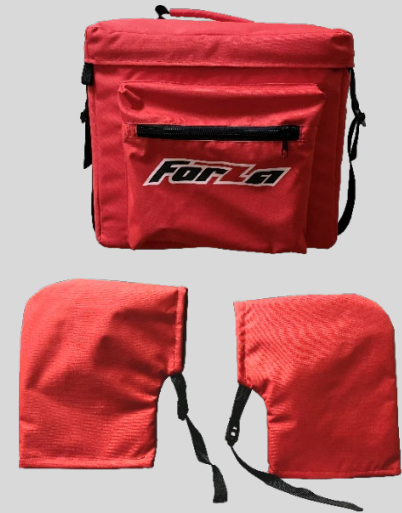
Комплект зимний для мотобуксировщика (сумка+рукавицы)